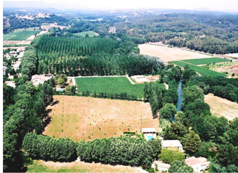
La Vallée du Lez