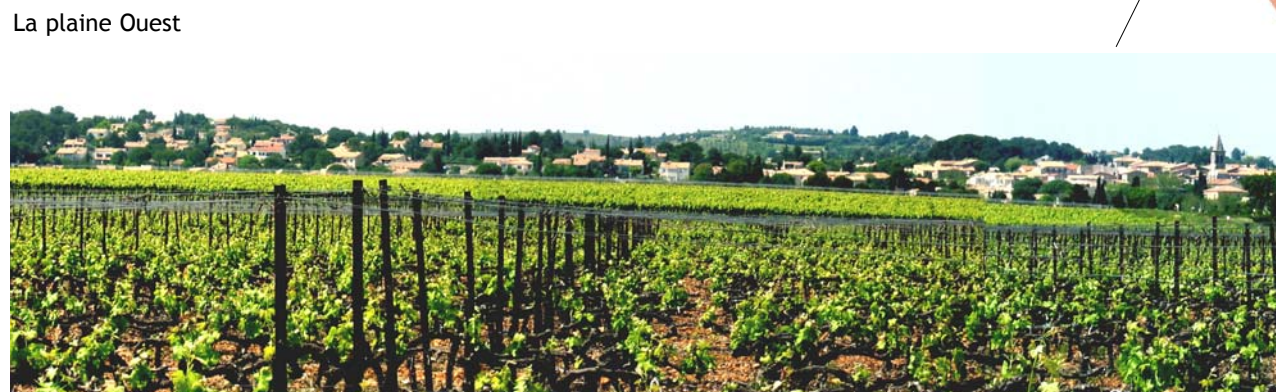
La plaine Ouest