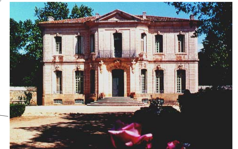
Chateau de l'Engarran à Lavérune