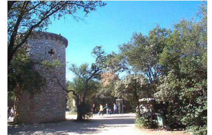
Parc Zoologique de Lunaret